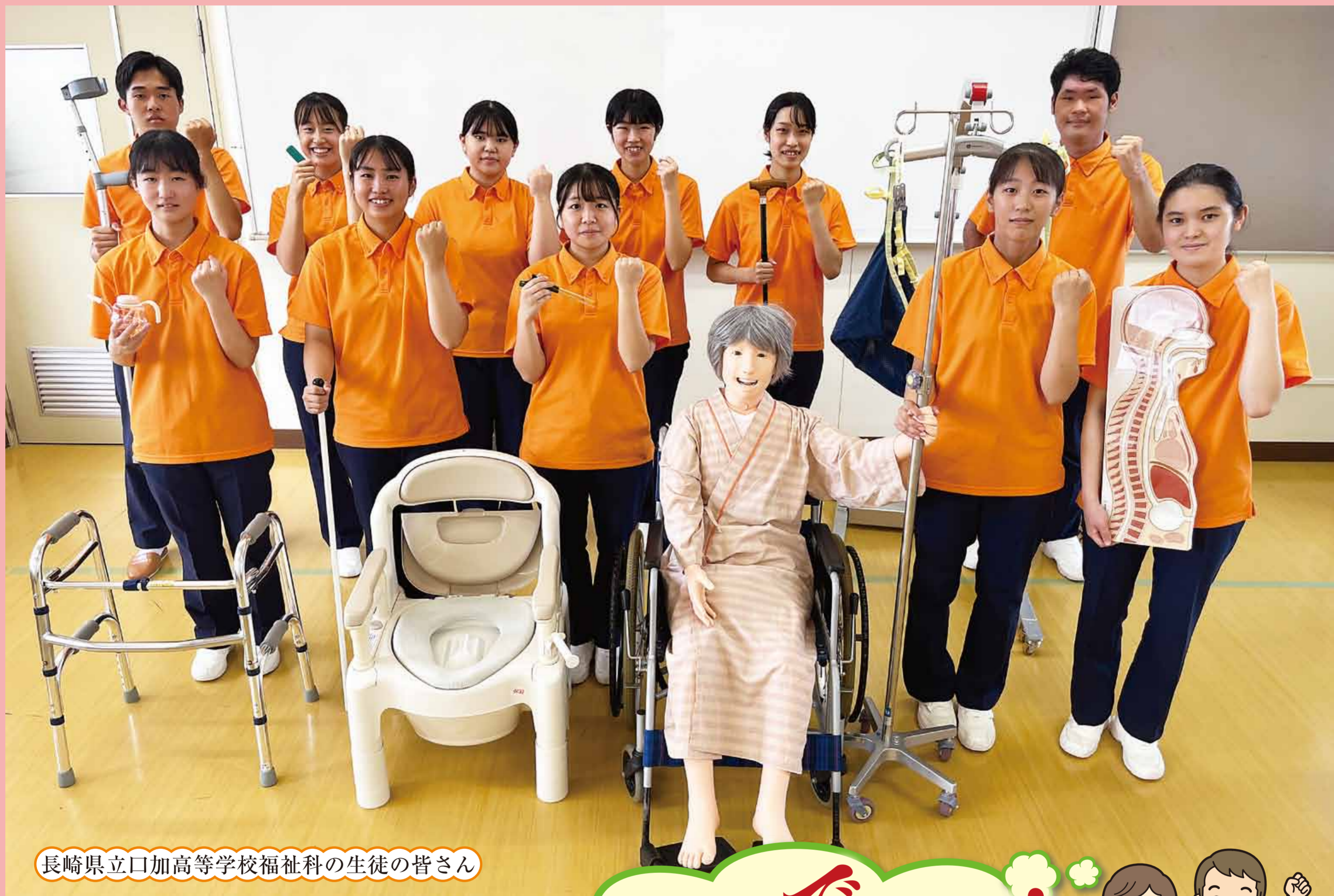
長崎県立口加高等学校福祉科の生徒の皆さん