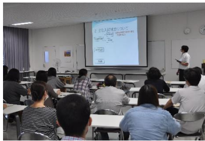
【進学活動について】