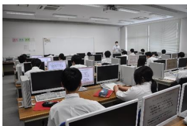
【情報技術科の様子】