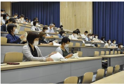
【就職活動について】

6月26日(金)午後6時より、3年生の保護者の方々を対象に「進路説明会」を開催しました。内容は、就職希望者向けに、「本校の就職状況と今年度の就職活動について」(進路指導部長より)、進学希望者向けに、「本校の進学状況と今年度の進学活動について」(進学担当より)と「奨学金について」(奨学金担当者より)でした。各担当より詳しい説明がありました。当日は、多くの保護者の皆さんに参加していただき、本校の進路活動や進路状況について理解を深めてもらいました。お忙しい中、ご参加いただきありがとうございました。これから始まる進路活動に向け、非常に有意義な会となりました。