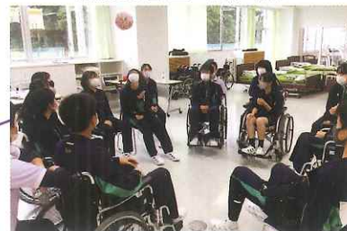
介護実習室（福祉科）