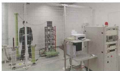
高圧実験実習室（電気科）