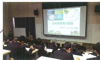
総合産業教室（267名収容）