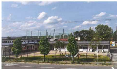
農場管理室 & 農業実習棟